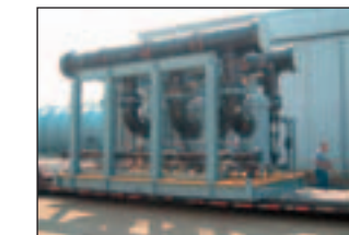
Filteranlage für „Injection Water“ mit drei BOLL-Automatilkfiltern TYP 6.18, DN 400

Spezialisten aus verschiedenen Kompetenzfeldern mit Detailkenntnissen der typischen, wichtigen, entscheidenden und kritischen Anforderungen spezieller Applikationen erarbeiten hier in Teams und in enger Kooperation mit den Filteranwendern Lösungen und Systeme, die der jeweiligen Aufgabenstellung optimal angemessen sind.