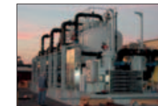
„Produced Water“ Anlage mit BOLL-Automatilkfilter TYP 6.18, Filterfeinheit 50 Mikron