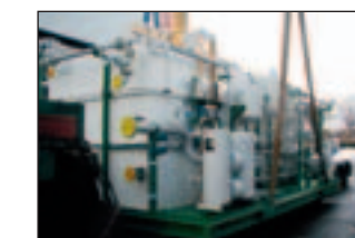
Schmierölversorgungsanlage für Kompressor Station mit BOLL-Duplexfilter TYP BFD-P